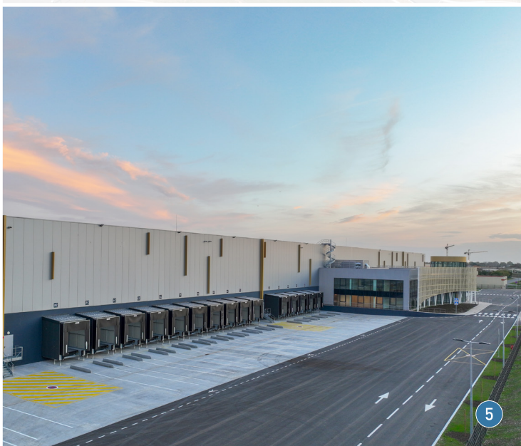
MER (41) - PARC DES PORTES DE CHAMBORD