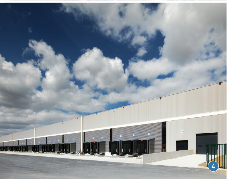
ROYE (80) - ZAC DU MOULIN