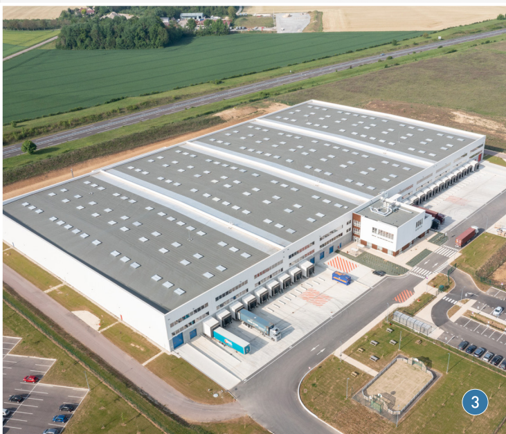
MOUSSEY 2 - TROYES (10) - PARC LOGISTIQUE DE L'AUBE