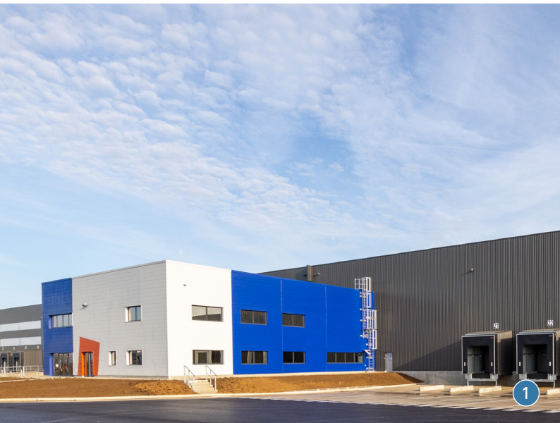
MOUSSEY 1 - TROYES (10) - PARC LOGISTIQUE DE L'AUBE

Notre valeur ajoutée : répondre aux nouvelles exigences de gestion des flux (chargeurs, distributeurs et prestataires), avec le souci de :