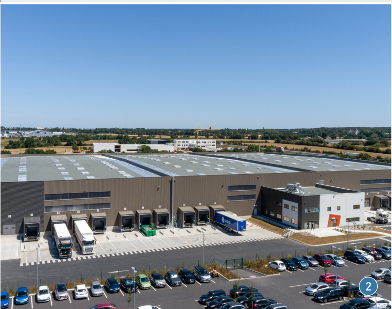
CHOLET (49) - PARC DU CORMIER